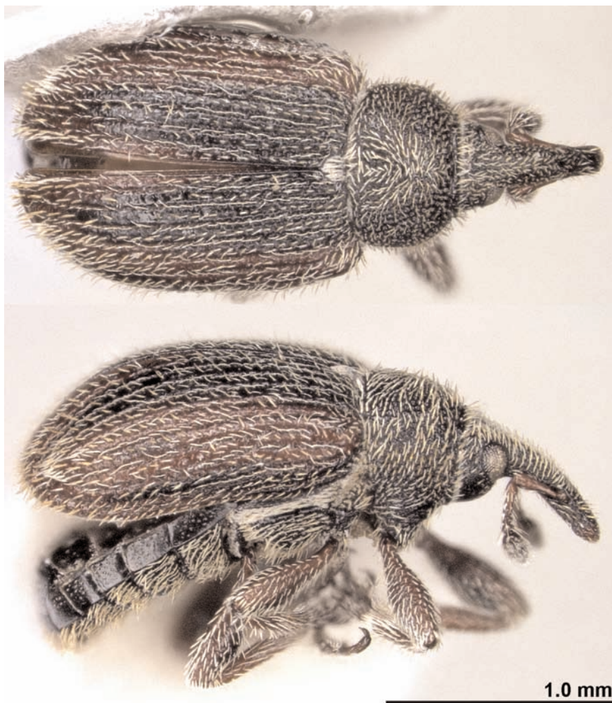
Fig. 1. Habitus (dorsal, lateral) of the adventive Gymnetron rotundicolle Gyllenhal, 1838, canton Ticino, Porza. The photos were taken using the VHX-2000 photograph system version 2.2.3.2. (Keyence Corporation) at the NMBE.

Lombardia: Monguzzo (Como), 31.3.2012, leg. & coll. L. Diotti; 3 males, 2 females, Lago di Alserio (Como), 2.6.2012, leg. & coll. L. Diotti; 2 males, 3 females, Emilia Romagna, Varano (Parma), 12.11.2010, leg. & coll. L. Diotti; 1 male, Umbria: Monte Martano, Giano dell'Umbria (Perugia), 700–900 m a.s.l., 25.5.2012, leg. & coll. A. Paladini.